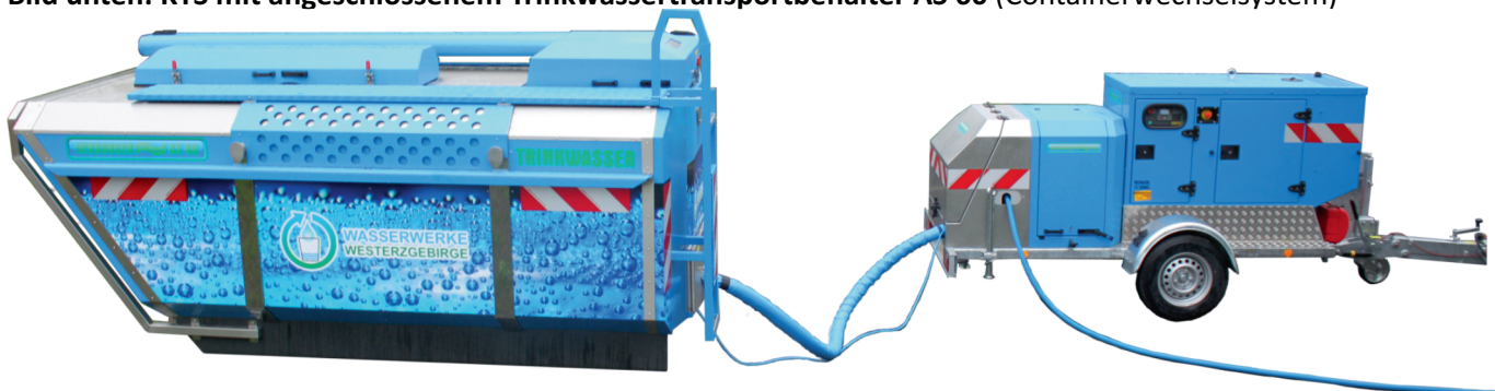
Bild unten: KTS mit angeschlossenem Trinkwassertransportbehälter AS 60 (Containerwechselsystem)